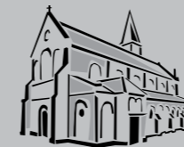
St. Antonius Zuffenhausen