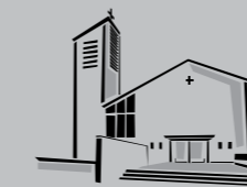
Zum Guten Hirten / Buon Pastore Stammheim

Fanno parte di questa comunità gli italiani residenti nelle zone con i seguenti codici postali: 70378 Mönchfeld, 70435 Zuffenhausen, 70437 Freiberg/Rot, 70439 Stammheim, 70469 Feuerbach, 70499 Giebel/Weilimdorf Orario Ufficio P. Daniele mercoledì 16.00 – 19.00 o su appuntamento telefonico