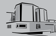
St. Laurentius / Nossa Senhora de Fatima Freiberg