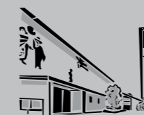
Hl. Dreifaltigkeit Rot / Zazenhausen